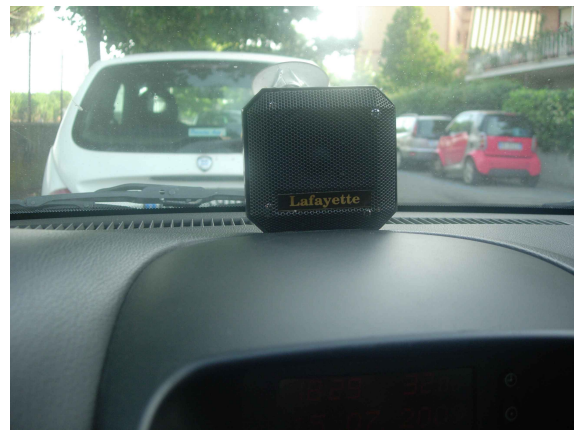
... finalmente in auto

nella realtà l'altoparlante si trova più in basso perché non deve oscurare la visuale.