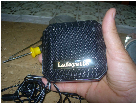
Il “cuore” del progetto