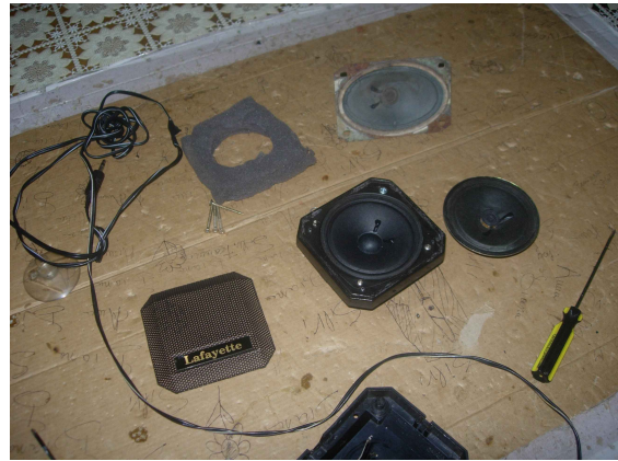
Le diverse parti